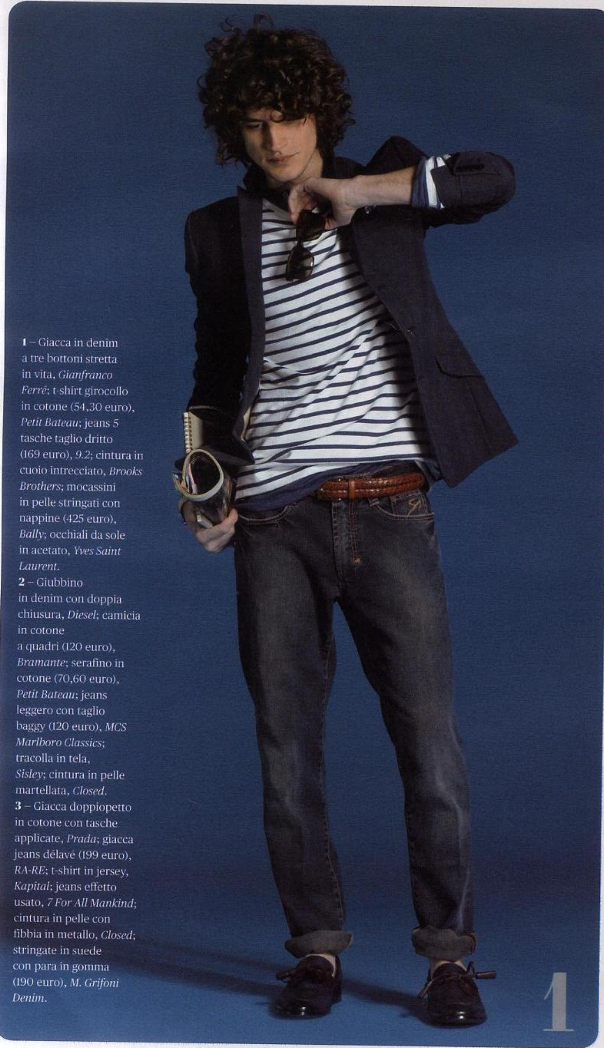
1 - Giacca in denim a tre bottoni stretta in vita, Gianfranco Ferré ; t-shirt girocollo in cotone (54,30 euro), Petit Bateau ; jeans 5 tasche taglio dritto (169 euro), 9.2; cintura in cuoio intrecciato, Brooks Brothers ; mocassini in pelle stringati con nappine (425 euro), Bally ; occhiali da sole in acetato, Yves Saint Laurent . 2 - Giubbino in denim con doppia chiusura, Diesel ; camicia in cotone a quadri (120 euro), Bramante ; serafino in cotone (70,60 euro), Petit Bateau ; jeans leggero con taglio baggy (120 euro), MCS Marlboro Classics ; tracolla in tela, Sisley ; cintura in pelle martellata, Closed . 3 - Giacca doppiopetto in cotone con tasche applicate, Prada ; giacca jeans délavé (199 euro), RA-RE ; t-shirt in jersey, Kapital ; jeans effetto usato, 7 For All Mankind ; cintura in pelle con fibbia in metallo, Closed ; stringate in suede con para in gomma (190 euro), M. Grifoni Denim .